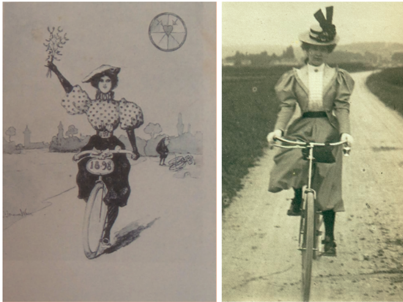
FIGURE 10 : Hansi (Jean-Jacques Waltz), dessin pour carte postale, 1898 et Jeanne Rozerot, également vers 1898. (Émile-Zola et Massin 1979) © Tous droits réservés. Le bouleversement de la vie privée d'un écrivain rejoint ici l'imaginaire médiatique et technique de toute une époque : le mouvement perpétuel des roues de la bicyclette nous assure que le changement - entre autres rendu visible par la jupe-culotte - est là pour de bon.