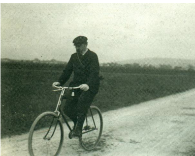
FIGURE 13 : Zola à bicyclette sur les routes de Médan, vers 1900 (Émile-Zola et Massin 1979) Bien en selle sur sa bicyclette, harnaché par la courroie de son appareil photo portatif qui le suit partout, l'écrivain n'est au fond pas si différent de l'« homo intermedialis » (Gaudreault) inventé par Grant à la même époque.