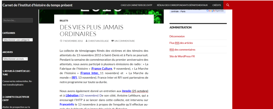
FIGURE 3 – Extrait du billet n° 8, capturé le 31 janvier 2019

Ou encore celui-ci, extrait du billet n° 8 et mettant en évidence de manière concrète les traces de l'activité scientifique du collectif dans les médias d'information au public :